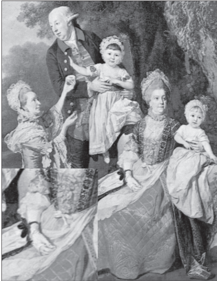
Ilustr. 2. J. Zoffany, Rodzina Bradshaw , ok. 1770-1775, (fragment obrazu), Londyn, Tate Gallery